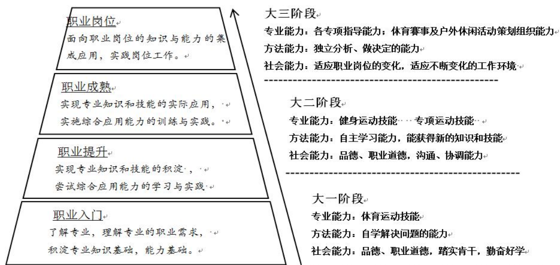
图 1 休闲体育专业学生职业岗位能力成长导图